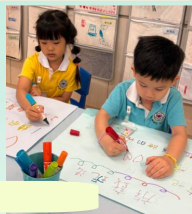
籌備環保遊戲日中...