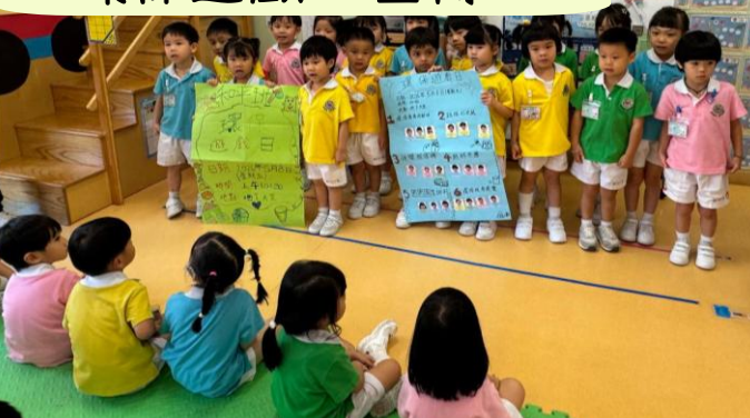
環保遊戲日宣傳日