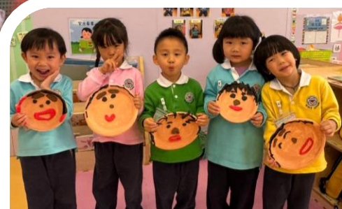
製作情緒面譜-認識不同情緒