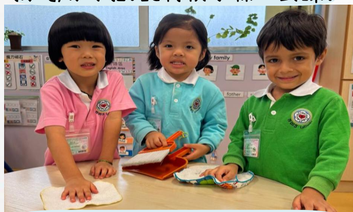
清潔桌面！人人有責！