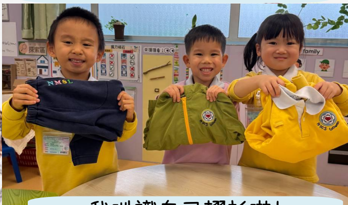
我哋識自己摺衫啦！