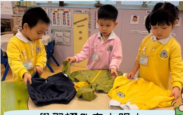
學習摺外套衣服中...