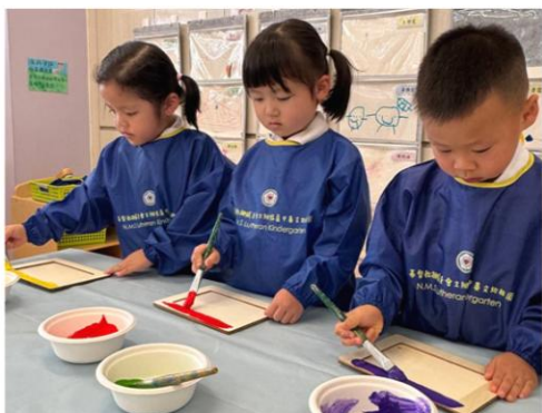
運用水彩為相框增添色彩！