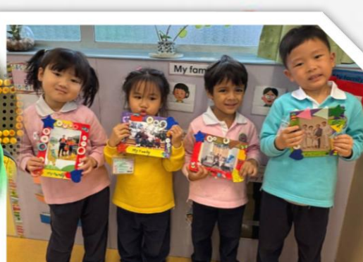
完成後，加入家庭照放在家中欣賞~