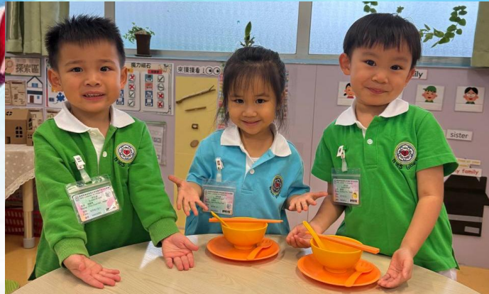
我哋成功啦！記得筷子係一對㗎！