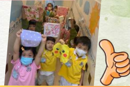
我哋都有帶手巾呀!