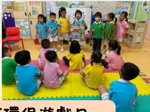
到高班宣傳「環保遊戲日」