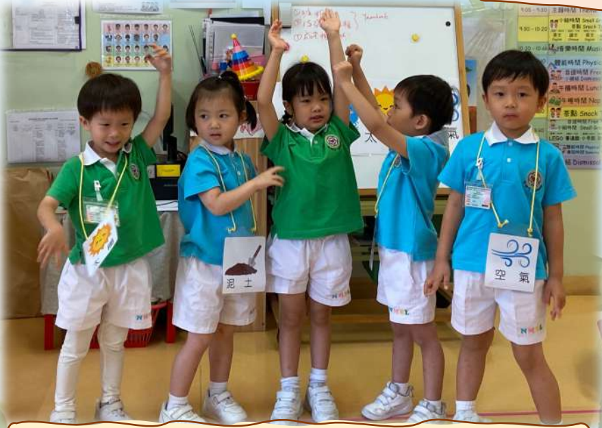
你睇，仲有足夠嘅空氣，植物最後長高喇。