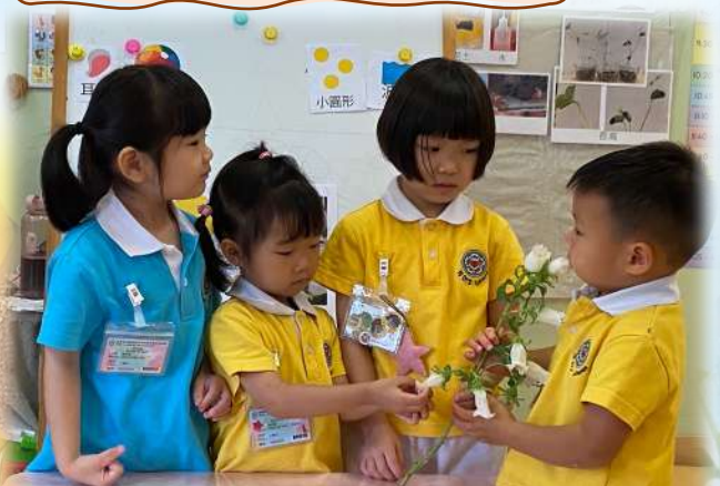
風鈴花好似燈籠咁。