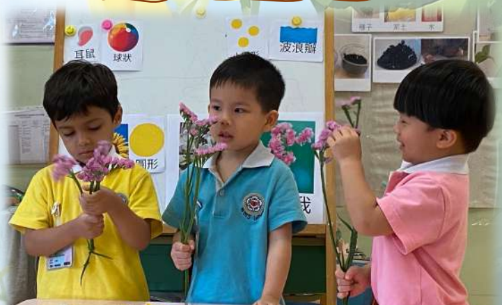
勿忘我似老鼠耳仔。