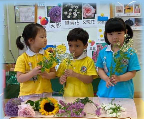
雛菊花好似小圓點。