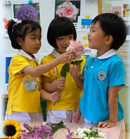
玫瑰花側面好似波浪紋，好香啊。