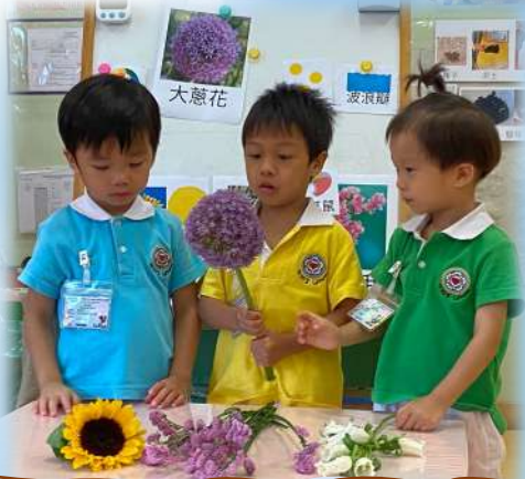
大蔥花好大陣味，好似個波。