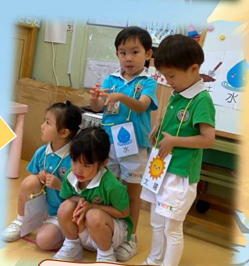
仲有陽光為種子提供養分。