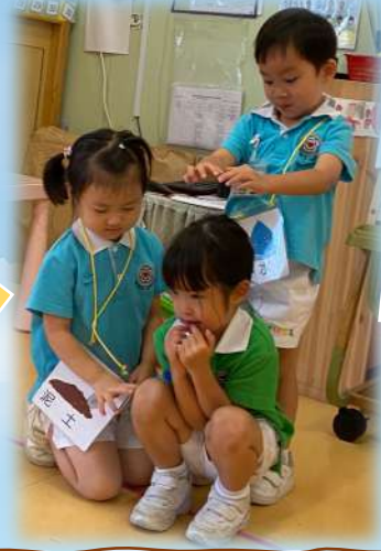
種子開始發芽喇！加啲水落種子度先。