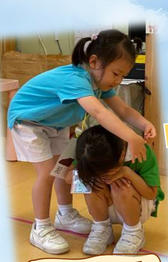
種子會住喺泥土裏面。